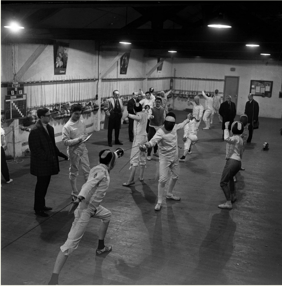
Photos de la toute première salle d'armes du TUC, rue Arnaud Vidal